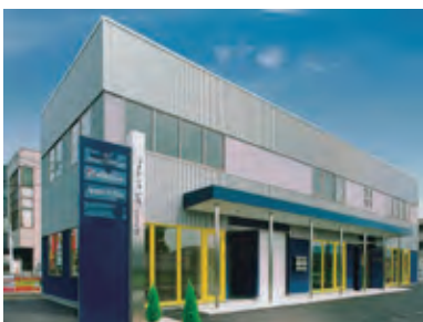
▲事務所/ライセンスビル1F